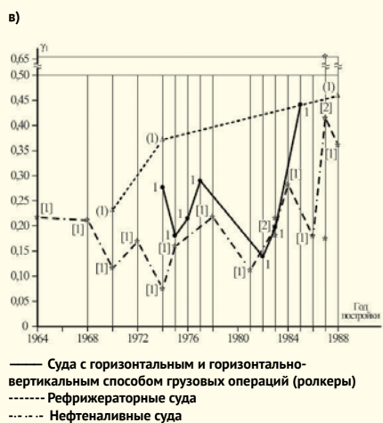
Рис. 2. Графики зависимостей \gamma_1 = f(t) основных серий транспортных судов России

у рефрижераторных судов, (0,114...0,392) кВт/т — у судов для перевозки массовых грузов, (0,126...0,274) кВт/т — у лесовозов, (0,164...0,392) кВт/т — у лесовозов-пакетовозов, (0,114... 0,298) кВт/т — у судов для перевозки массовых грузов (навалочников), (0,047...0,655) кВт/т — у наливных транспортных судов, (0,075...0,655) кВт/т — у нефтеналивных судов, (0,047...0,077) кВт/т — у нефтерудонавалочников, (0,242...0,471) кВт/т — у грузопассажирских судов.