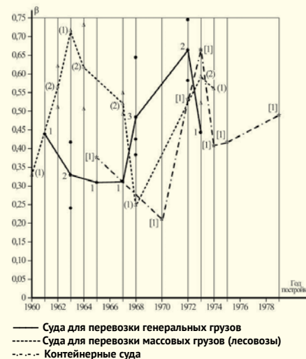
Рис. 3. Графики зависимостей \beta = f(t) основных серий судов Дальневосточного бассейна

В [5] представлены результаты расчетов коэффициентов электровооружен-