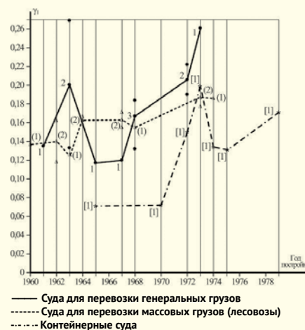
Рис. 1. Графики зависимостей \gamma_1 = f(t) основных серий судов Дальневосточного бассейна

Кроме того, обработан статистический материал по широко используемым сериям морских транспортных судов России, построенных с начала 1960-х до середины 1990-х гг.