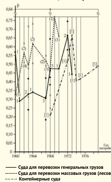
Рис. 4. Графики зависимостей \beta = f(t) основных серий транспортных судов России

Анализ полученных результатов показывает, что развитие элект-