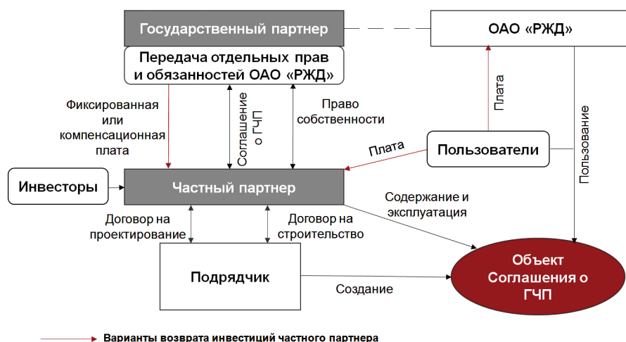
Рис. 1. Схема работы соглашения о ГЧП на железнодорожном транспорте

Безвозвратность вложенных грузовладельцами инвестиций в объекты инфраструктуры в условиях снижения